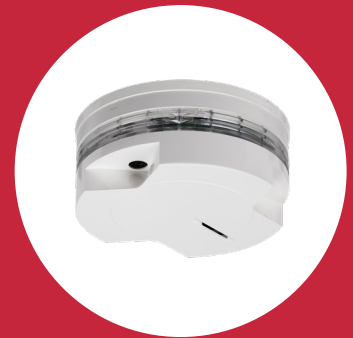
WEBINAR „C1 Rauchwarnmelder“

Der Rauchwarnmelder C1 wartet mit Neuerungen auf, die Installation und Umgang mit Statusmeldungen erleichtern. Wir haben besonderen Wert auf die Integration in unsere Empfangs- und Managementsysteme gelegt.